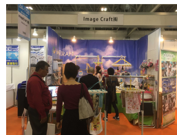
昨年度の出展の様子