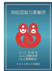
消防団協力事業所表示証