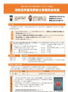
消防団員雇用貢献企業報奨金制度リーフレット

(県 HP) https://www.pref.gifu.lg.jp/page/17412.html