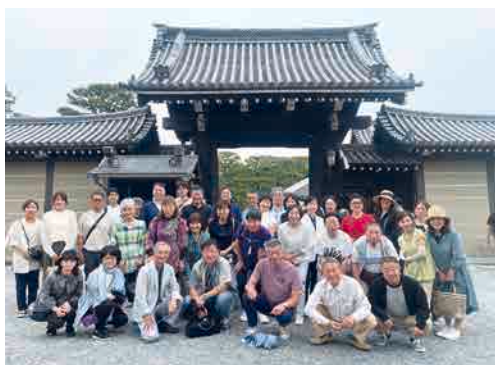
▲京都御所での集合写真

たくさんの方にご参加いただき会員相互の交流の時間となりました。ご参加いただいた皆様ありがとうございました。