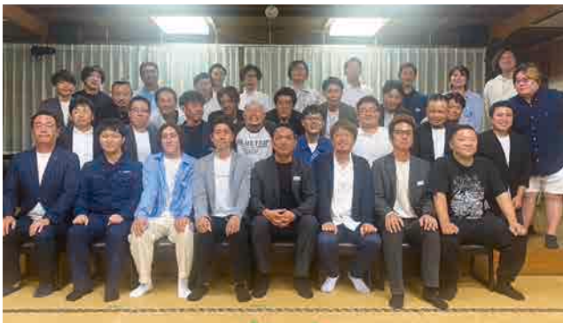
▲参加した青年部員のみなさん

本例会は、今後1年間の青年部活動への意識向上及び部員間の交流、また部員拡大を目的に開催し、拡大広報委員会企画のアトラクションの実施や「6月関YEGとの交流会」「9月花火大会」へ向けて部員間の結束を高めました。