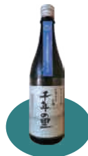
かすみのお酒「千年の里」