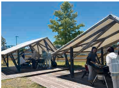
▲風を感じながら最高のロケーションで実施されました

4グループに分かれ、バーベキューの合間にゲームを楽しみながら、会員相互の交流を行いました。天候にも恵まれ、会員の笑顔あふれる例会となりました。