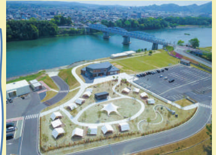
リバーポートパーク

また、自然学習エリアも充実しており、文化施設では「ヤマザキマザック工作機械博物館」があり、歴史的な工作機械や蒸気機関車などが展示されています。自然と歴史、どちらも楽しめる魅力的な街です。