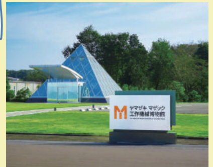
ヤマザキマザック工作機械博物館