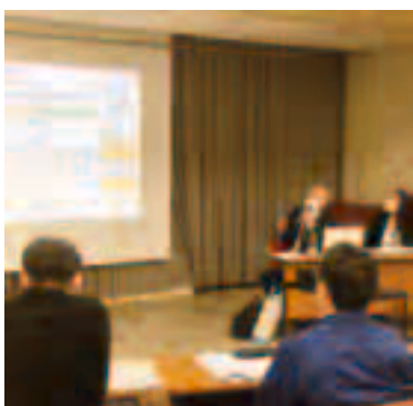
▲具体例を用いながら説明いただきました

雇用計画や求人票は時代に合わせ見直しを行うことが必要であり、現在の社会に合った求人と雇用を行うべきであると言われ、外国人従業員についても、国として雇い入れにおいて随時制度が改正されており、人材確保で求人活動をされる際に、自社が求める求人内容と外国人の在留資格と内容（技能実習・特定技能）を比較し、雇用戦略に組み込むことも考えてほしいと話されました。