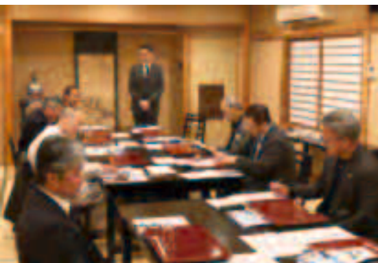
▲説明を行う牧田県議