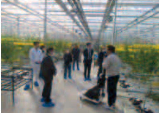
▲農場内を見学する様子

今回の視察を通じて、農業分野だけでなく、物流や通信、運輸の分野におけるDXとの親和性についても多くの示唆を得ることができました。