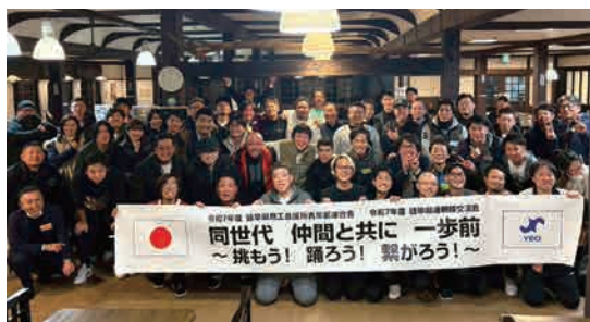
▲親睦交流会に参加した青年部員のみなさん

忘年会では、ダンスの感想をきくかけに各単会や自社の話題など幅広い交流が行われ、親睦を一層深める機会となりました。