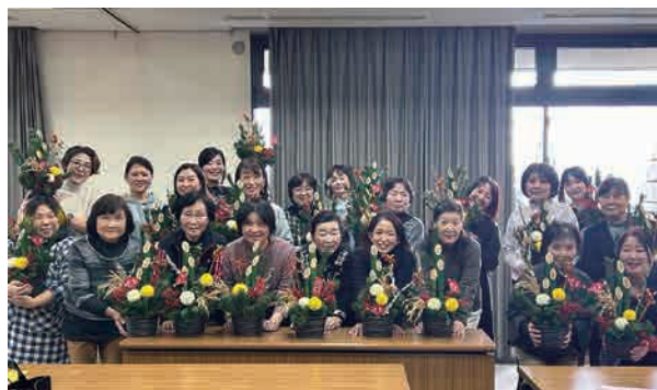
▲完成した門松と撮影