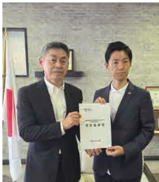
要望書を手渡す則竹会頭（写真左）

則竹会頭は、不透明さを増す中東情勢について、予想以上に長期化するのではないかと懸念を示し「地域経済や事業者に与える影響は計り知れない。当所の景況調査でも、4月以降、全業種において物価や資材、原材料価格の高騰に加え、物流コストの上昇や資材確保難など、供給面における様々な課題や影響が現れ始めている。特に中小・小規模事業者は大変厳しい状況にある」と述べ、美濃加茂市を支える事業者への配慮を要請しました。