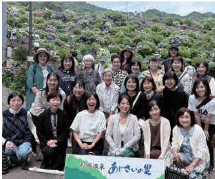
▲100種5万株のあじさいの前で

昼食は海鮮市場「魚太郎」でバーベキューを行い、新鮮な魚介類や食材を味わいました。その後は市場で買い物を楽しみ、地元の特産品やお土産を購入しました。参加者同士の交流を深めながら、充実した一日を過ごすことができました。