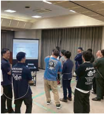
▲クイズに挑む様子

会場は終始、活発な意見交換と笑い声に包まれ、新しい組織のチームワークを高めるとともに、仲間の魅力を再発見できた、素晴らしいスタートダッシュの例会となりました。